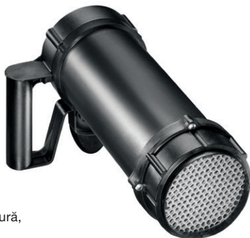
Dispozitiv de uniformizare testovent 417.