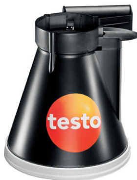
Pâlnie pentru anemostate circulare, Ø 200 mm