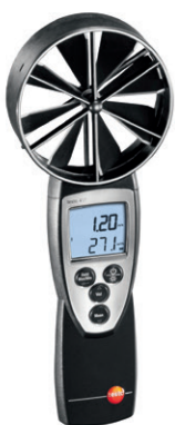
Instrument de măsură, de ex. testo 417.