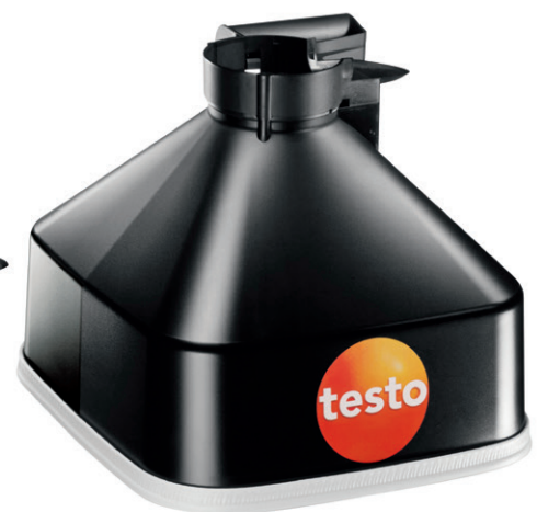
Pâlnie pentru anemostate rectangulare, 330 x 330 mm.